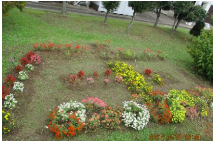
花倶楽部の花壇 今年は『庄』