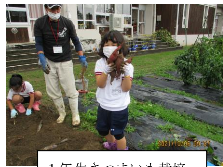
1年生さつまいも栽培