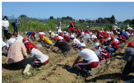
保全会との全校さつまいも掘り