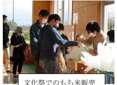
文化祭でのもち米販売