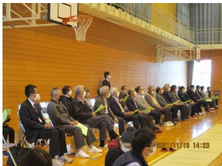
収穫を喜び感謝する会の来校者